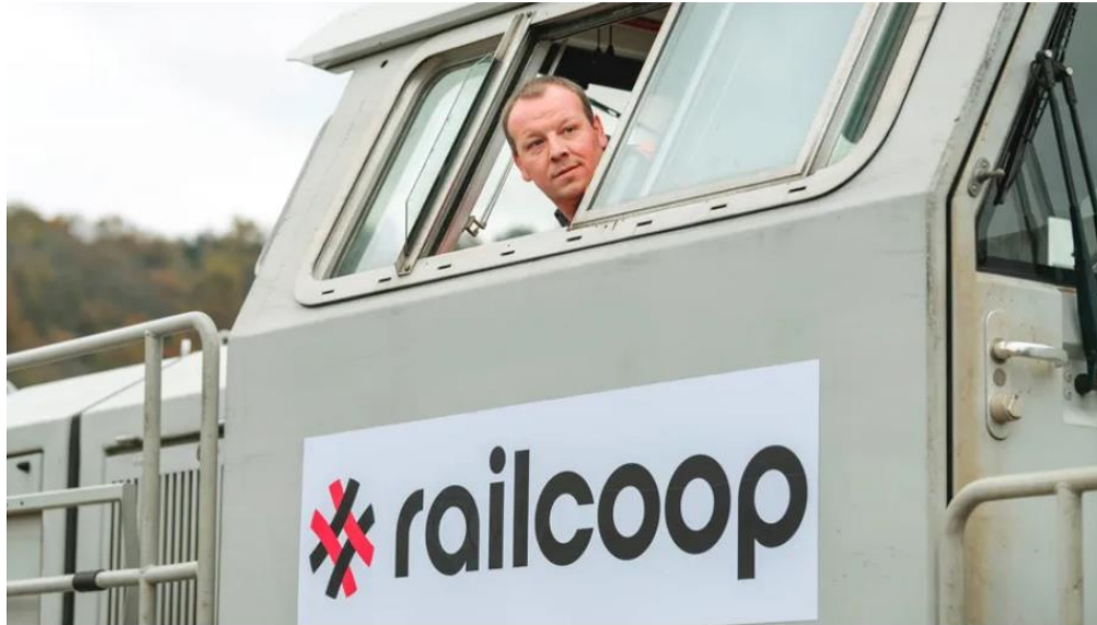
Railcoop a déjà inauguré son service fret à Capdenac dans le Lot le 15 novembre 2021.

Description des modalités d'enquête et présentation de notre ancrage théorique.