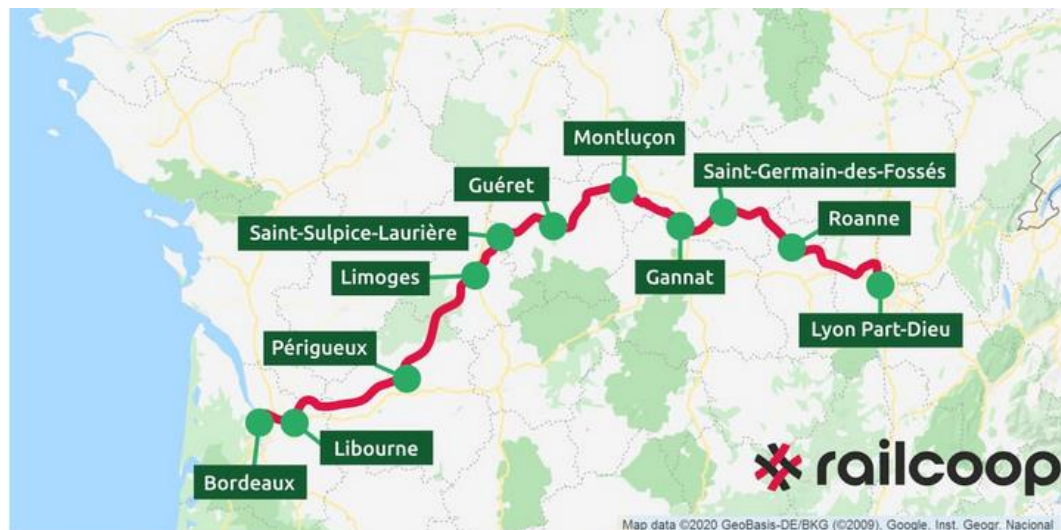
RailCoop veut relier Lyon à Bordeaux dès 2022.

Premières tentatives d'analyse des résultats & des effets produits sur la démocratie.